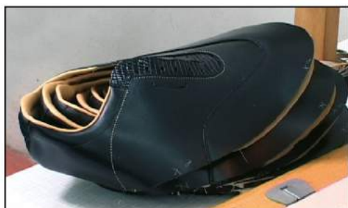
CUCITURA MODIFICA 2 AGHI OPTIONAL

Machine Mod. C997M0-0 can come either with EFKA DC 1550 control 220 V-50/60 Hertz motor or with Ho-Sing or FIR (clutch type) motors While Machine Mod C997/M0-R is equipped with EFKA motor only.